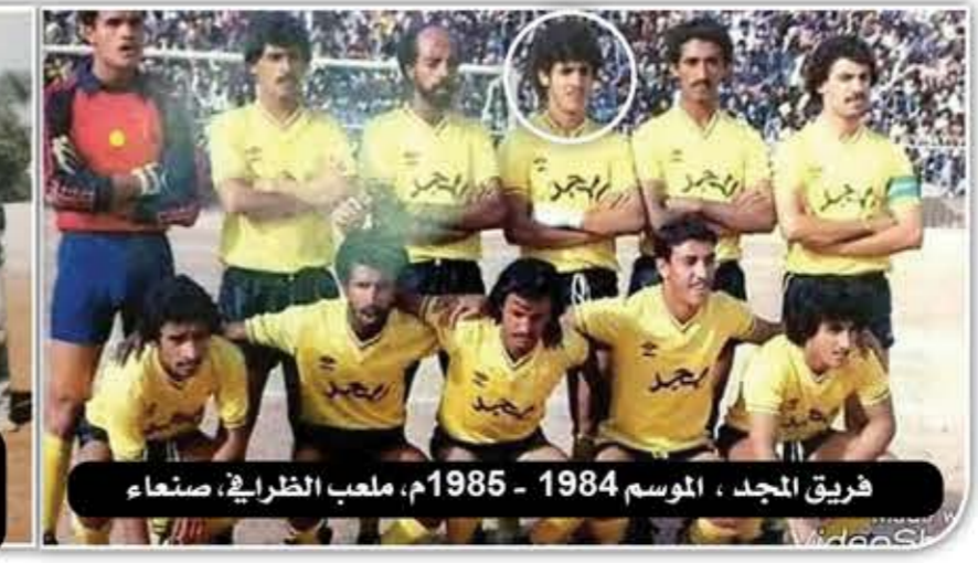
فريق المجد، الموسم 1984 - 1985م، ملعب الظلي، صنعاء