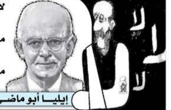
إيليا أبو ماضي

لا تقعدن عن الجهاد إلى غد فلقد يجيء غد وأنت غبار ماذا يفيدك أن يكون لك الثرى ولغيرك الأصال والأسحار من ليس يفتح للنهار جفونه هيهات يكحل مقلتيه نهاراً