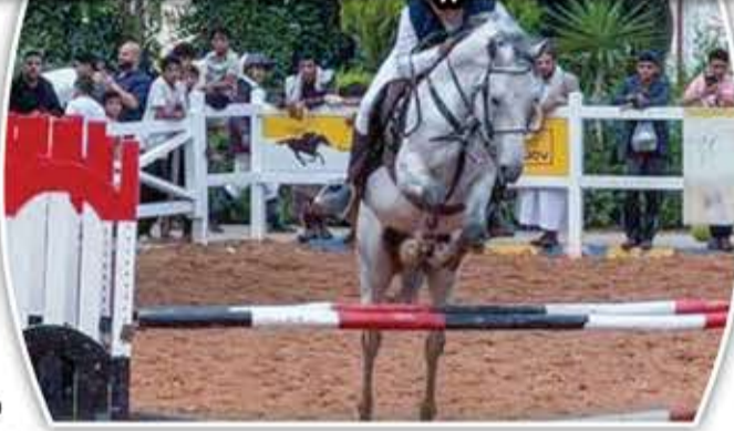
وتنافس 13 فارساً أمس الأول (الخميس) على قطع

يشارك في البطولة، التي تستمر حتى 24 رمضان، 70 فارساً من الفئات العمرية المبكرة (أ، ب، ج، د، هـ) يمثلون أكاديمية نادي الوحدة وعدداً من الجهات الحاضنة للخيل.