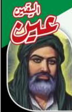
الإمام علي بن أبي طالب عليه السلام

حسبك من العلم أن تخشى الله، وحسبك من الجهل أن تعجب بعلمك.