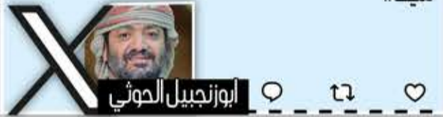
أبو زميل الموهي

للأسف يا أنصار الله، تركتم المجال بشكل كبير للعدوان يشوه المسيرة كيفما أراد، وذلك بصمتكم الرهيب حول أغلب القضايا، ومنها قضية خالد العراسي. احترموا تضحيات الشهداء. احترموا محاضرات وتوجيهات القائد. عهد مالك الأشتر سلسلة كاملة ولا استفدتم منها شيئاً!!