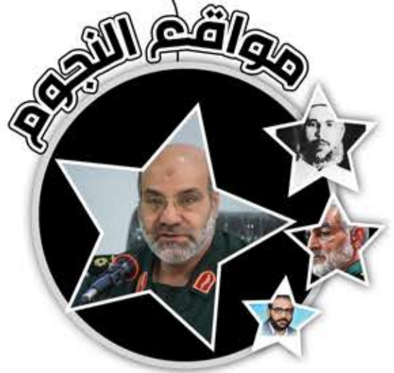
محمد رضا زاهدي

ولد محمد رضا زاهدي عام 1960، في مدينة أصفهان. انضم إلى حرس الثورة الإسلامية عام 1980، وكان أحد القادة المهمين فيه خلال الحرب العراقية الإيرانية، وقائداً للواء (44) من عام 1983 إلى 1986. تولى قيادة فرقة الإمام الحسين بين عامي 1986 و1991. تولى قيادة المقر المسؤول عن أمن العاصمة طهران ومنطقتها من عام 2005 إلى 2006. تولى قيادة القوات البرية لحرس الثورة بين عامي 2005 و2008. وقبلها تسلم لمدة قصيرة قيادة القوة الجوية للحرس الثوري. انتقل عام 2008، للخدمة في فيلق القدس، ليصبح من كبار القادة حتى عام 2016، ثم شغل منصب مسؤول العمليات في الحرس الثوري كما عمل نائباً للعمليات في حرس الثورة الإسلامية عام 2017 ولمدة ثلاث سنوات. عاد للعمل قائداً لقوة القدس في سورية ولبنان من عام 2020 حتى 2024. في 1 نيسان/ أبريل 2024، نفذت قوات الاحتلال الصهيوني، غارة جوية استهدفت القنصلية الإيرانية في دمشق، مما أدى إلى استشهاده واستشهاد 6 من المستشارين بجانبه.