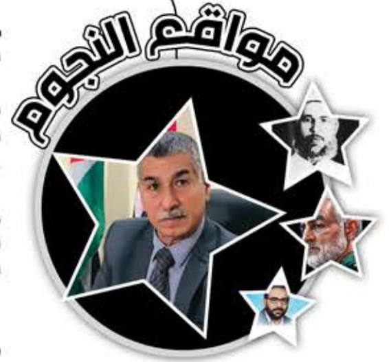
طلال أبو ظريفة

الصهيوني . أشاد كثيرا بتشكيل الغرفة المشتركة لفصائل المقاومة الفلسطينية عام 2018: «إن تصدي المقاومة المشرف بغرفة العمليات المشتركة، ترسيخ لمعاني الوحدة الوطنية» . أسهم بفاعلية في انتفاضات الشعب الفلسطيني ضد قوات الاحتلال الصهيوني فتعرض لملاحقتها خلال سنوات انتفاضة الأقصى، ونجا من عدة محاولات اغتيال، وخلال اجتياح قرية عيسان عام 2003، تم تفجير منزله بالكامل . رفض النزوح من منزله وأصر على البقاء رغم أهوال حرب الإبادة التي يشنها الكيان الصهيوني على قطاع غزة عقب عملية «طوفان الأقصى» وقال: «لن نغادر غزة، نحن ندعو الناس إلى الصمود والصبر وسنكون طليعة ذلك» . استشهد مع رفيقه محمود حمامي في 2024/5/12، جراء غارة جوية استهدفت منزلا كانا بداخله جنوبي مدينة غزة . قالت الجبهة في بيان نعيه: «استشهد وهو يقود المقاومة ضد الغزو البربري الإسرائيلي في حي الصبيرة جنوب شرقي مدينة غزة كما استشهد إلى جانبه الرفيق محمود حمامي» .