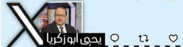
يحيى أبو زكريا

يوم سكت الرؤساء والملوك العرب والمسلمون على إحراق القرآن الكريم في السويد، رفعت أنت المصحف الشريف في جمعية الأمم المتحدة مدافعاً عنه. ألا قتل الله أهل التفريق بين السنة والشيعة، بين المسلمين!