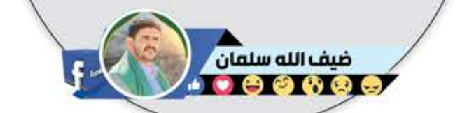
ضيف الله سلمان

(سلام على إبراهيم) • لقي الله ولم يحمل في قلبه ذرة من الولاء لليهود والنصارى. • مواقفه منسجمة مع الإسلام والقرآن. • لم يخذل فلسطين يوماً عندما خانها المنبسطون. • رفع كتاب الله في الأمم المتحدة بكل عزة وشموخ، وقال: «هذا الكتاب لن يفنى أبداً». رفعه بيده عالياً، مؤكداً أن هذا الكتاب باق ما بقيت السماوات والأرض. • وجهه صفة قوية للكيان المؤقت واللقيط. • رحمة الله تغشاه ورفاقه كل وقت وحين.