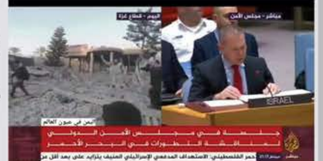
مجلس الأمن - جلسة في مجلس الأمن الدولي للمناقشة التطورات في البحر الأحمر سبتمبر 2023 - مؤتمر صحفي: الاستهداف المدعني الإسرائيلي للعنف يزداد على بعد أقل من