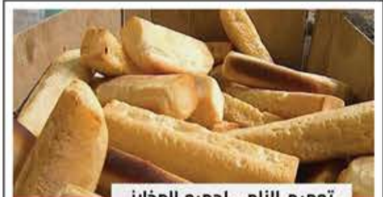
تعميم إلزامي لجميع المخازن

سلطات تعز تحدد سعر قرص الروتي الواحد بـ 60 ريالاً وسعر الثلاثة الأقراص بـ 200 ريالاً وسعر الكيلوا بـ 1400 ريالاً