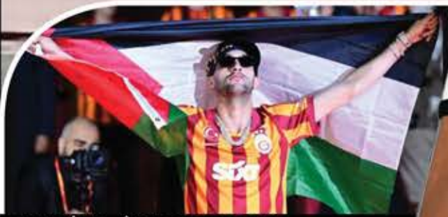
المغربي حكيم زياش يتوشح العلم الفلسطيني خلال احتفالات نادي غلطة سراي بلقب الدوري التركي، أمس.