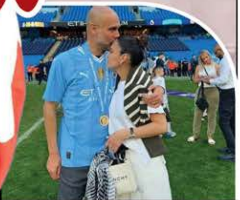
الاسباني بيد جوارديولا مدرب مانشستر سيتي وابنته ماريا بالوشاح الفلسطيني في ختام الدوري الإنجليزي