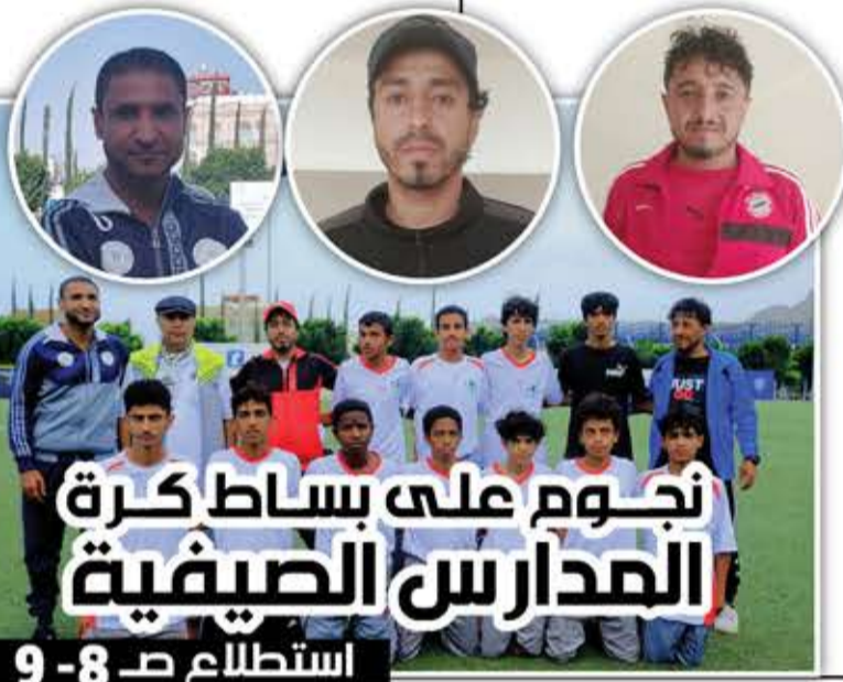
نجوم على بساط كرة المدارس الصيفية

الأربعاء 29 مايو / أيار 2024 العدد (1394) 07