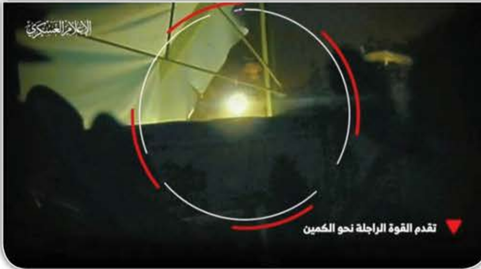
تقدم القوة الراجلة نحو الكمين

في الأثناء، يطالب عشرات من أهالي الأسرى الصهاينة في قطاع غزة رئيس الوزراء نتنياهو بالتوقيع على صفقة لإعادة الأسرى فوراً، بينما تشهد المدن في الكيان الصهيوني مظاهرات عنيفة تطالب بالإطاحة بنتنياهو.