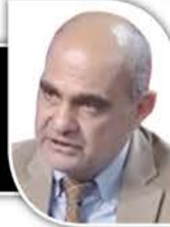
شارك أبي نادر

نجاح المسيرة اليمنية في استهداف العمق الحيوي لـ «تل أبيب»، والمسخرة لحياتها أهم قدرات العدو في الدفاع الجوي، يثبت أن مستوى المواجهة ضد الكيان قد ارتفع لدرجة حساسة ومؤثرة وفاعلة لا يمكن أن تنخفض بعد اليوم، ومع الفشل الغربي (الأمريكي -البريطاني تحديداً) في وقف أو إضعاف مناورة الإسناد اليمنية، يمكن القول إن إسرائيل، لن تنجح في مواجهة هذا المسار الذي بدأ يفرض نفسه عليها.