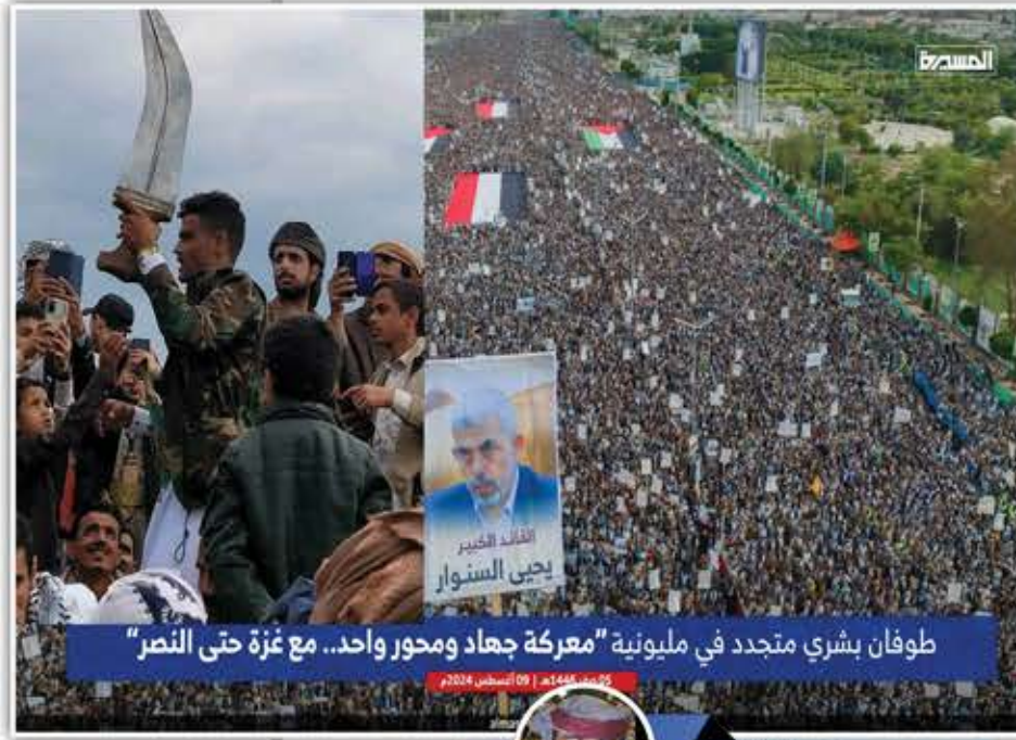
طوفان بشري متجدد في مليونية "معركة جهاد ومحور واحد... مع غزة حتى النصر"