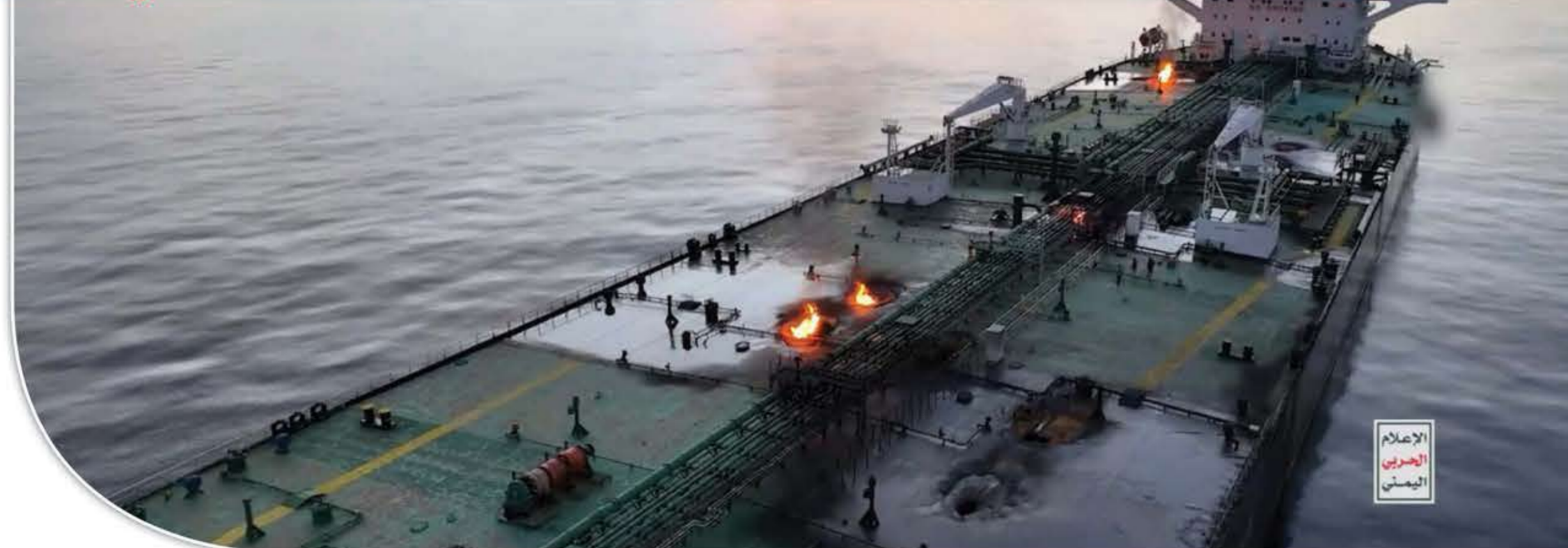
الإعلام البحري اليمني

ومع ذلك، ونظراً للاستقلال الاستراتيجي لليمنيين، فحتى طهران لا تستطيع ضمان السلام المطلق للإمارات. وأخيراً، فإن الإمارات حريصة على الانتقام في الصراع على النفوذ داخل اليمن بـ«النخبة الجنوبية»، التي نشأت بمشاركة أبوظبي؛ ولكن لم تتمكن قط من الانفصال خلال المرحلة الحادة من الصراع (رغم أنها أعلنت استقلال الجنوب عدة مرات)، وخلال فترة الهدوء وجدت نفسها مدفوعة إلى الخلف من قبل السعوديين من حكم «اليمن الموحد».