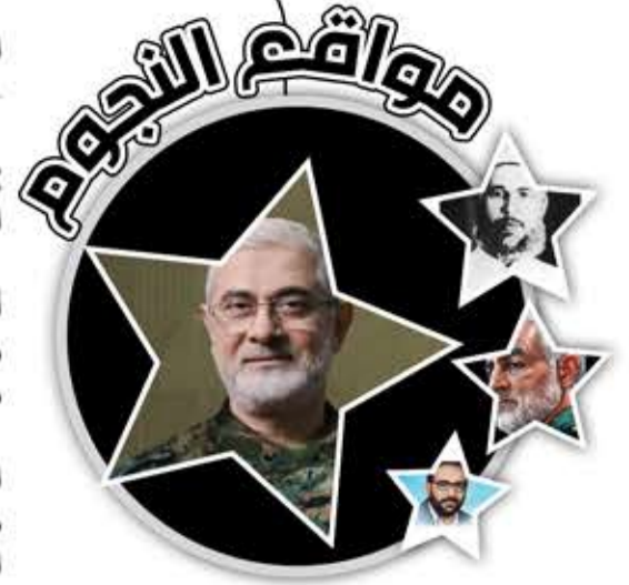
إبراهيم عقيل (الحاج عبدالقادر)

شغل منذ العام 2008، منصب معاون الأمين العام للحزب لشؤون العمليات، والعمل الجهادي بشكل عام، وعُين عام 2015، عضواً في المجلس الجهادي وهو أعلى مجلس عسكري للحزب. كان من القادة الكبار الذين خططوا وأداروا العمليات ضد الجماعات التكفيرية على حدود لبنان الشرقية وفي القصور والقلمون، وبقية المناطق السورية. خطط وأشرف على قيادة العمليات العسكرية لقوة الرضوان على جبهة الإسناد اللبنانية منذ بداية معركة طوفان الأقصى في 8 تشرين الأول/أكتوبر 2023. تولى منصب قائد المجلس العسكري خلفاً للقائد فؤاد شكر عقب اغتياله من قبل طائرات الاحتلال الصهيوني في بيروت في 2024/7/30. اتهمه السلطات الأميركية بالمساهمة في تفجير سفارتها ببيروت، وكذا الهجوم على ثكنات مشاة البحرية الأميركية (المارينز) عام 1983، والذي قتل فيه 241 عسكرياً أميركياً. ورصدت مكافأة بقيمة 7 ملايين دولار لمن يدلي بمعلومات عنه. استشهد في 2024/9/20، حيث أطلقت طائرة صهيونية من طراز «إف 35» صاروخين على شقة في الضاحية الجنوبية لبيروت.