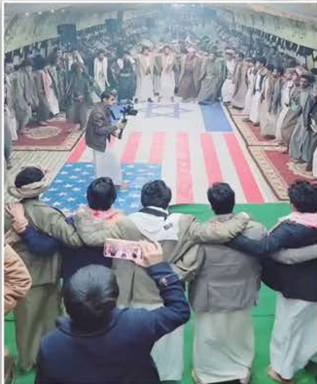
This dance in Yemen speaks a THOUSAND words