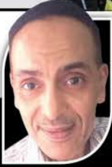
إيهاب شوقي كاتب مصري