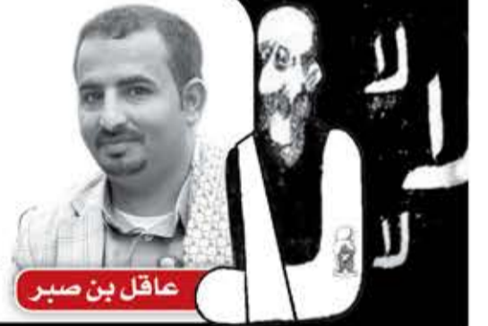
عاقل بن صبر

لا نقضس فيتو ولا فتوى أمم غربا تنقض قرار اليمن وخيار ابو جبريل واقسى العقوبات والتهديد والإغرا ما غيرت موقف البأس اليمني ميل فيالق القدس خلف الراية الخضرا آيات تتلى على الترتيب والترتيل