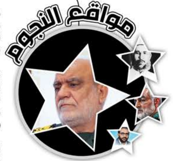
علي مجيد خادمي

برز اسم خادمي بوصفه أحد العقول الأمنية الأكثر تأثيراً في بنية الحرس الثوري. فقد شكّل نموذجاً نادراً يجمع بين العمق الأكاديمي والخبرة العملية في قلب الأجهزة الحساسة وفي أخطر الملفات والتحديات الاستخباراتية.