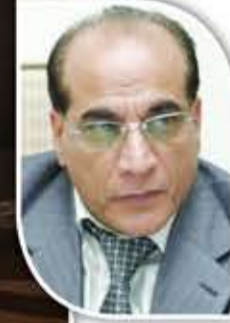
مروان ناصح كاتب درامي سوري

كم من طفل في الحي وقف مأخوذاً أمام دكان الحدّاد، يرقب الشرر كأنه نجومٌ تسقط إلى الأرض. ولعلّ هؤلاء الأطفال، حين كبروا، أدركوا أن ما رأوه لم يكن لهباً فحسب، بل دروساً في الشغف والإصرار. فالنار لا تطفى الأحلام، بل تضيئها لمن يعرف كيف يتعامل معها.