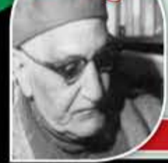
عباس محمود العقاد

أعرف الناس بالكرامة أشدهم حرصاً على كرامة سواه.