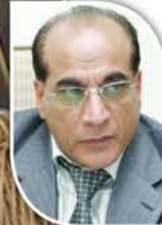
مروان ناصح كاتب درامي سوري

ثياب العيد. لم يكن النساج يبيع فحسب، بل كان يعرض روحه منسوجة في خيوط ملونة، ينتظر أن يراها تبهج عيون الناس، فذلك هو ريحه الحقيقي.