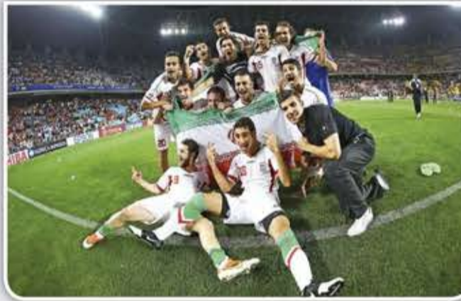
من جهة أخرى، تتجه الأنظار إلى احتمال مواجهة مرتقبة بين الولايات المتحدة الأمريكية وإيران في كأس العالم للجماهير.

2026، في مباراة قد تكون من الأكثر شحنا سياسياً في تاريخ البطولة، وسط مخاوف لدى الاتحاد الدولي لكرة القدم "فيفا" من سيناريو معقد. ورغم وجود المنتخبين في مجموعتين مختلفتين، إلا أنهما قد يلتقيان في الدور الأول من الأدوار الإقصائية. وبحسب محاكاة أولية أجرتها شبكة "Football Meets Data" ونشرتها صحيفة "ذا صن"، يواجه منتخب إيران كلا من بلجيكا ومصر ونيوزيلندا ضمن المجموعة السابعة، وتشير التوقعات إلى احتلاله المركز الثاني. ويقع منتخب الولايات المتحدة في المجموعة الرابعة إلى جانب تركيا وباراجواي وأستراليا، من المتوقع أن يتأهل المنتخب الأمريكي من دور المجموعات في المركز الثاني. وفي حال تحقق ذلك، فإن المنتخبين سيلتقيان وجهاً لوجه في مدينة دالاس يوم 3 يوليو.