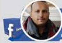
محمد الفائق حساب بديل

سعودي) ثمن خيانتته ثم توجه مع أسرته لأداء العمرة! وقف في أظفر بقاع الأرض، بملابس الإحرام، ليرفع يديه بـ«خشوع» ويدعو: «اللهم بارك لي فيما رزقتني»!!