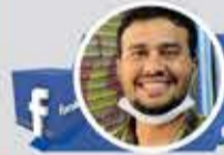
Safer Al Seri

هؤلاء يجب إعدامهم في مكان عام، لتكون رسالة لغيرهم أن العمالة ليست وظيفة يترزق منها، بل خيانة عظمى وعار أبدي خالد.