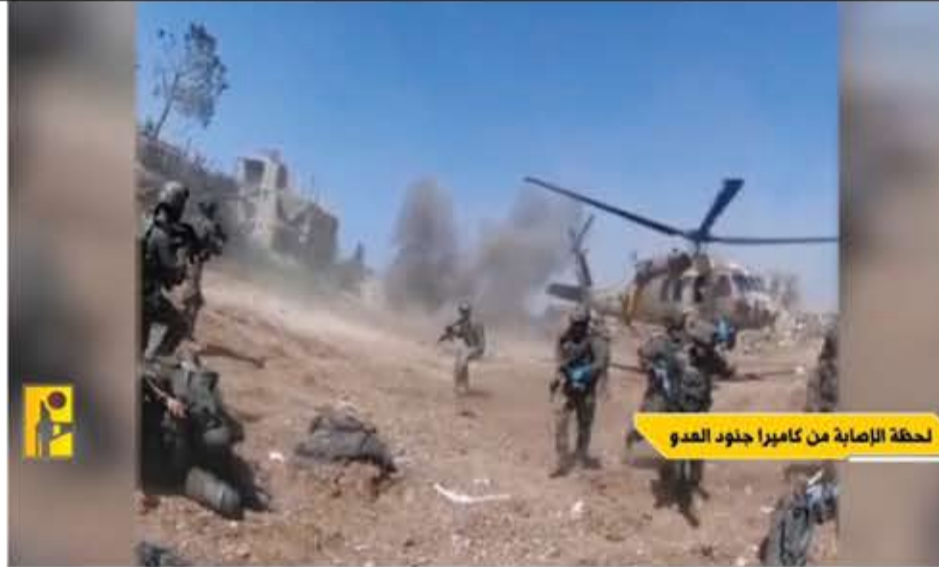
لحظة الإصابة من كاميرا جنود العدو

وفيما كان السفير الأمريكي يبحث مع الرئيس جوزيف عون، «تثبيت الهدنة»، غير الموجودة أصلاً، كان الميدان ينطق بالحقيقة: العدو الصهيوني يشن حرباً مفتوحة توقع كل يوم شهداء ومصابين، ناهيك عن عمليات التدمير والنسف.