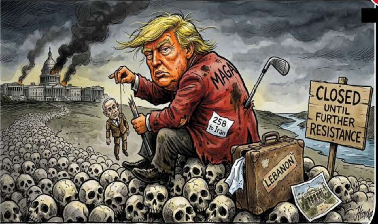
64 DAYS OF EPIC FURY

في تحليل لافت، يؤكد خبراء «فورين بوليسي» أن «إيران تتبع نهج هو تشي منه»: القوى الإمبريالية تتعقب قبل أصحاب الأرض، ويوجز المعلق إدوارد لوس في «فايننشال تايمز» الحقيقة: «ترامب هو من بدأ الحرب، وإيران ستقرر متى تنتهي». لماذا؟ لأن الحصار الأمريكي «يستتني السفن الممتدة إلى الصين»، وباكستان «أعطت إيران الإذن باستخدام أراضيها كمر برب للتجارة». عسكرياً، يكشف حساب (David Z) عن شبكة أنفاق تحت الماء تضم 100 نفق وقواعد بحرية كهيبة، تجعل استهداف الغواصات الإيرانية «مستحيلاً فعلياً».