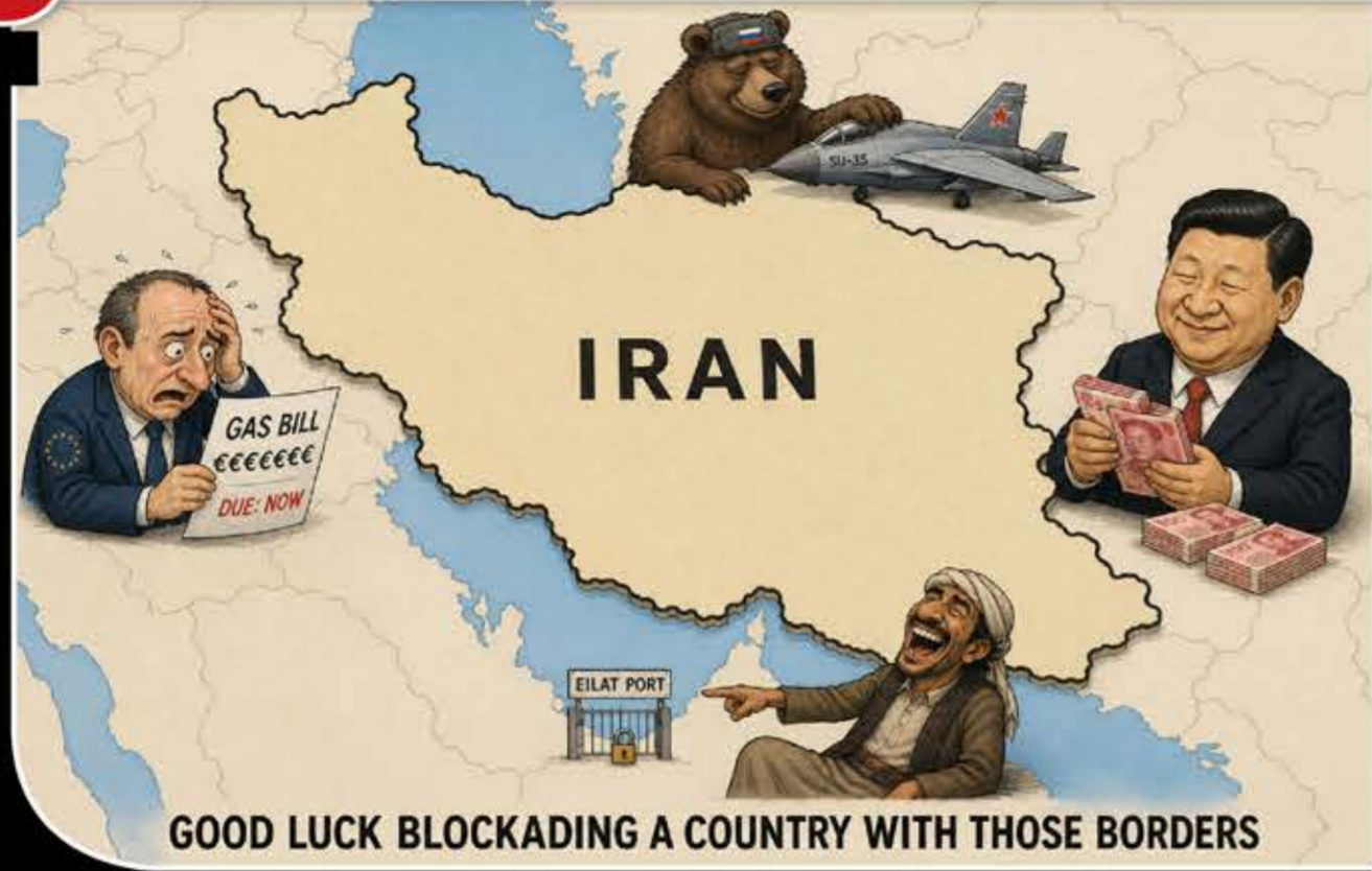
GOOD LUCK BLOCKADING A COUNTRY WITH THOSE BORDERS

رغم كل ما تقدم، لم تنته الحرب بعد. فبعد انقضاء مهلة الـ60 يوماً التي يمنحها قانون صلاحيات الحرب، تكشف الأخبار وطلال نحلة أن واشنطن «تدرس خيارات حافة الهاوية»: نشر صواريخ «دارك إيجل» الفرط صوتية (مداهم 3500 كم) في اعتراف بالهزيمة أمام الصواريخ الإيرانية المحصنة بالجبال، وحشد قاذفات (B-1B) و(B-52B) إلى بريطانيا لتنفيذ «قصف سجادي» من خارج المدى، وطرح عمليات إنزال بري على هرمز كدليل ياس. وتحدثت «القناة 14» الصهيونية