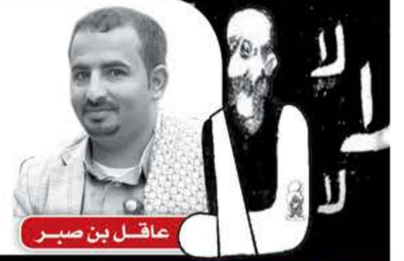
عاقل بن صبر

لا خير في دولة السيبي وطيب رجب ولا عجب يا ملوك الانفتاح العجيب يا خادم البيت الابيض عاد للبيت رب تجلت آيات ملكه وانجلي كل ريب النصر موعود والفتح المبين اقترب وما ترونه بعيد نراه منا قريب ما حد لتصنيف الارهابي ترامب ارتهب شعب اليمن موقفه ثابت وجيشه مهيب