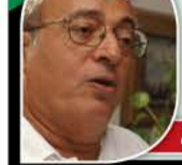
عبد الوهاب المسيري

إن السقوط في الوحل أسهل بكثير من الصعود إلى النجوم.