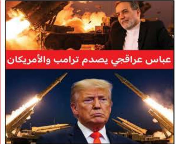
عباس عراقجي يصدّم ترامب والأمريكان