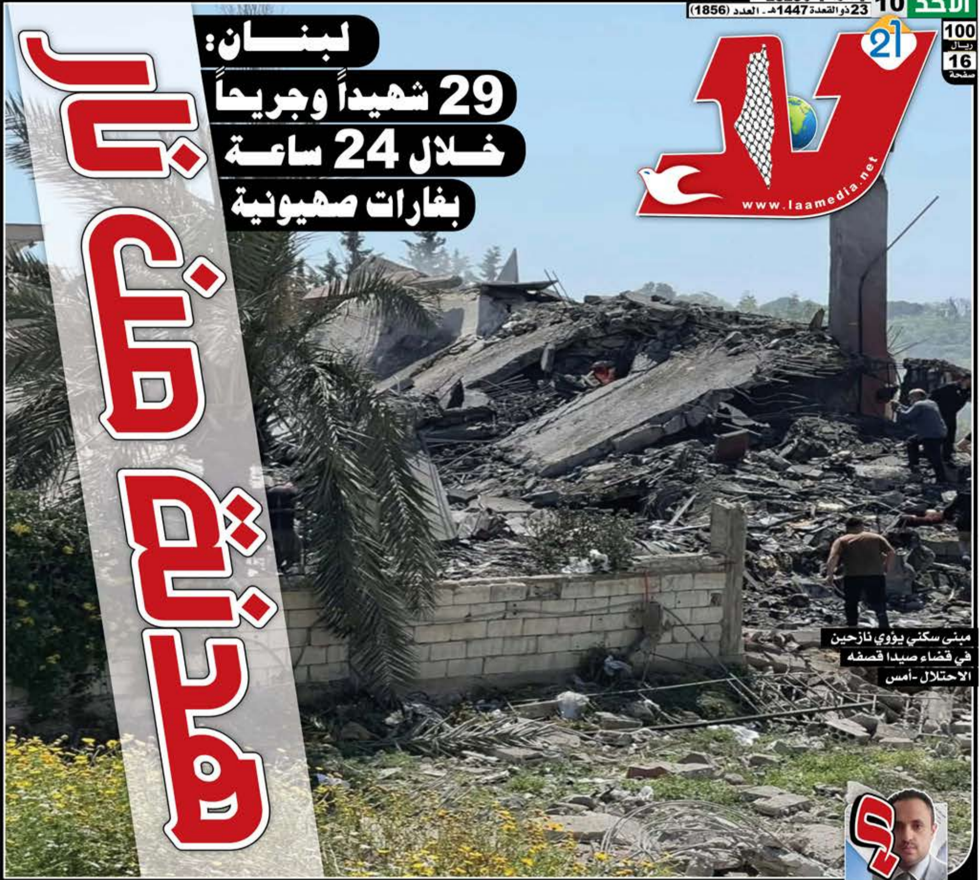
مبنى سكني يؤولي نازحين في قضاء صيدا قصفه الاحتلال - أمس