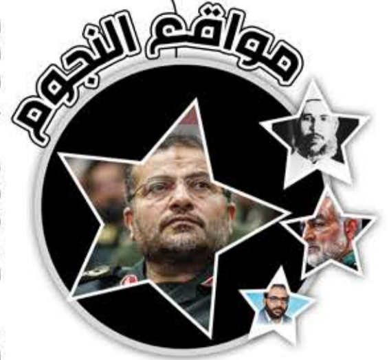
غلام رضا سلیمانی

ينتمي إلى جيل القادة الذين نشأوا في قلب التجربة القتالية منذ حرب «الدفاع المقدس» وصولاً إلى المواجهات المفتوحة والمركبة التي تخوضها الجمهورية الإسلامية في إيران بالتصدي للعدوان الصهيوني الأمريكي عليها.