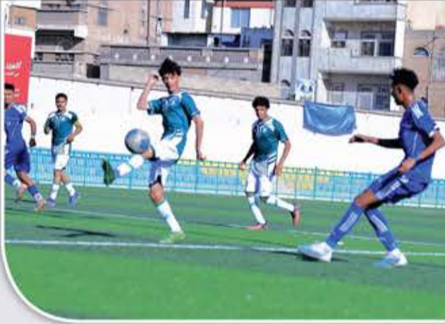
الحديدة على فريق قرناو الجوف (0/6) ليتأهل الهلال للدور الثاني، ضارباً موعداً مع فريق أزال في دور الـ32

للبطولة. وكان فريقاً تضامن حُزِمَت على هلال عوين (0/8)، والسد مَربِ الفَائِزَ على شباب جبن (0/6) قد تأهلا بفوزيهما إلى دور الـ32، الخميس الماضي. وسيوافه تضامن حُزِمَت فريق شمسان، فيما يواجه السد مَربِ وحدة المكلا في دور الـ32. ويلعب اليوم في دور الـ64، وحدة صنعاء مع ردفان سقطرى، اتحاد إب والشرطة، المكلا وشباب الزيدية، وسلام الغرفة مع شباب القدس. ويستكمل الدور الـ64، غداً، بقاء العروبة والجيل الصاعد، ورحبان حُزِمَت مع اتحاد حُزِمَت، ويلتقي الثلاثاء تضامن المحويت مع شعب حُزِمَت على ملعب الظرافي.