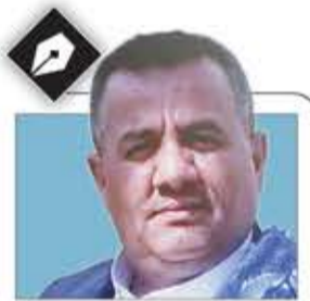
عبد الملك العقيدة

حرص السيد القائد على ذكر أدق التفاصيل التي تؤكد وجوب امتلاك الوعي في كل قيم الدين وأخلاق الدنيا، إنه ضرورة الوجود الإنساني والديني، أن تتحمل المسؤولية لامتلاك الوعي بشكل إنساني أو أممي، شعبي أو وطني، جماعي أو فردي. هذه المسؤولية هي رباط توحيد الوعي الجماعي والكلية لشعوب ومجتمعات الأمة كلها في معرفة