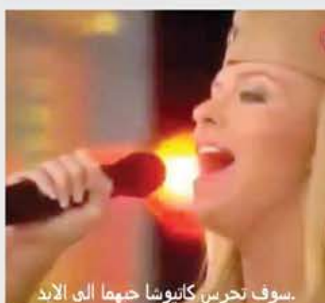
سوف تحرس كاتيوشا جهما الى الأبد.

وتعتبر أغنية "كاتيوشا" من أشهر الأغاني الشعبية التي رافقت الجنود والضباط السوفيت في جبهات الحرب الوطنية العظمى، وأحد رموز الانتصار على النازية، وأصبحت رمزاً للوفاء والصمود بالنسبة لأولئك الذين قاتلوا في الحرب وحببناهم اللواتي انتظرن عودتهم.