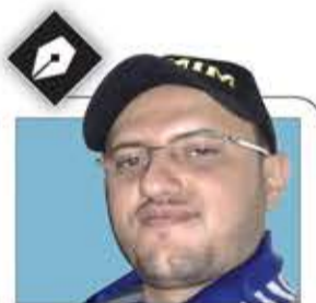
عبد الملك سام

بنو سعود كانوا الأكثر غباءً عندما اعتقدوا أن قراراً كهذا يمكن أن يحسن من موقفهم بالغ السوء.