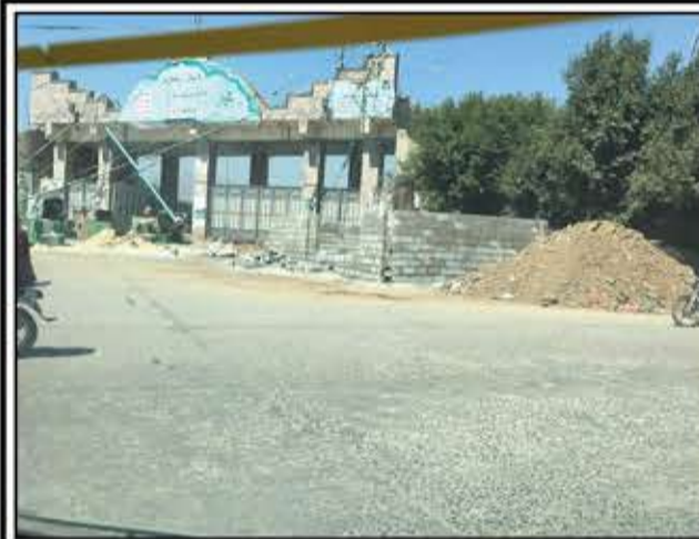
(في إ ب)

حبسوا واعتدوا على مدير الأشغال بالمحافظة والمديرية... وغلطوا عليهم وعلى المحافظ والوكيل... وزادوا غلقوا المسألة وكمّلوا الاستحداث الذي بدؤوه أمس في بوابة الجامعة، وناويين يصبوا السقف ويشطبوا...! أنتم يا سلطة محلية، حيركم بس على بسطات المساكين...!