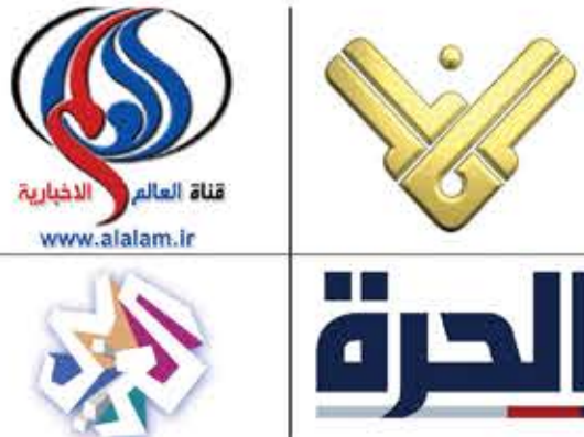
قناة العالم الاخبارية www.alalam.ir

وكذلك الحال بالنسبة لقناة «العربي» التي تجاهلت تماماً هذه الجريمة، ولم تشر إليها نهائياً.