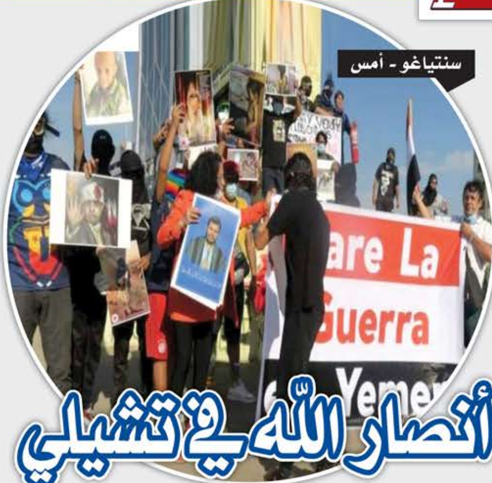
سنتياغو - أمس