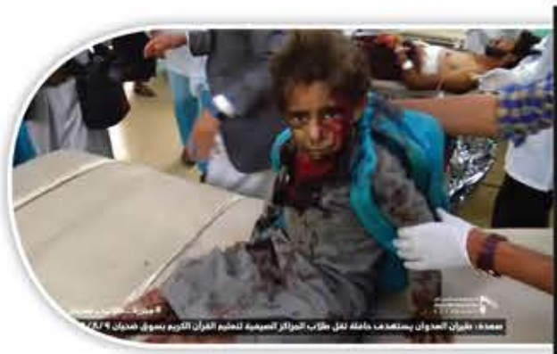
صورة: طيران العدوان يستهدف عائلة على طابقتهم في سوق صفاة بقيق