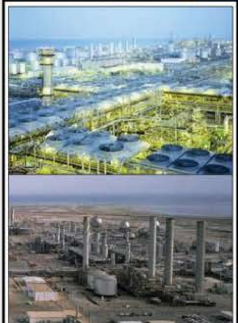
المدينة النفطية العالمية "راس تنورة" مكان دسم وقاسمة للنظام السعودي واقصادها الإرهابي واقتصاد الولايات المتحدة الأمريكية.