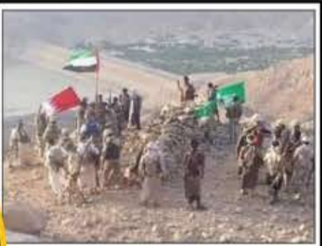
قبل 6 سنوات، وتحت نيران طائرات (الآباتشي) و(F16) و(تورنيدو) تم رفع هذه الأعلام فوق سد مأرب. اليوم جاء الوقت إسقاطها.