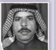
إبراهيم الأسود شاعر سودي

لا ينجلي حُسن اللاتين دون تكسير المحار فلنخلعن حجابنا عملاً بقانون الطواري ولنعلم الحرب بالآليات والسور القصار ولنضرب بطول عرض سلاحهم عرض الجدار