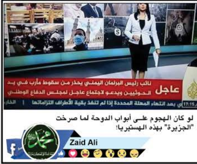
نائب رئيس البرلمان اليمني يحذر من سقوط مأرب في يد الحوثيين ويدعو لاجتماع عاجل لمجلس الدفاع الوطني 17:15 أي بعد انتهاء المحلة المحددة إذا لم تنفذ بقية الأطراف التزاماتها | الخبر

لو كان الهجوم على أبواب الدوحة لما صرخت "الجزيرة" بهذه الهستيريا!