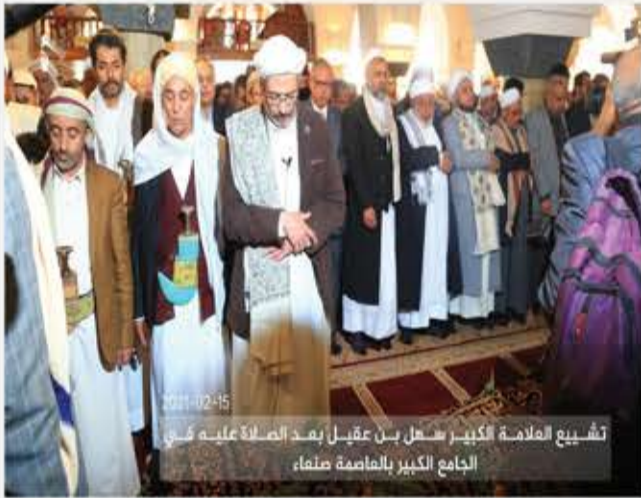
تشيع العلامة الكبير سهل بن عقيل بعد الصلاة عليه في الجامع الكبير بالعاظمة صنعاء،

صورة معبرة لصلاة على جنازة أحد علماء اليمن في صنعاء.