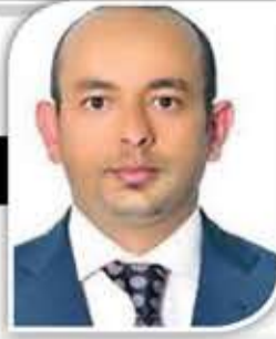
السفير محمد محمد السادة