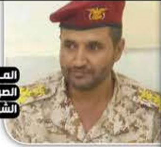
المرتزق الصريع الشرعي

ذات أهمية استراتيجية وطنية وعسكرية وسياسية واقتصادية واجتماعية.