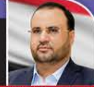
الرئيس الشهيد صالح الصماد

كشفت صحيفة «وول ستريت جورنال» الأمريكية، أمس، تعرض قصر اليمامة، مقر الديوان الملكي في الرياض، لهجوم بطائرات مسيرة، الشهر الماضي. ونقلت الصحيفة عن مسؤولين أمريكيين وأشخاص آخرين مطلعين على الموضوع قولهم إن طائرات مسيرة ثابتة الجناحين مليئة بالمتفجرات اصطدمت في 23 يناير بالمجمع الملكي الرئيسي في العاصمة السعودية.