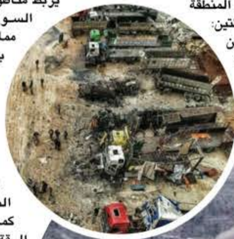
نظرة الشك والحذر من تركيا، والثانية: وجود رغبة

الرسائل السورية الروسية المباشرة وغير المباشرة إلى تركيا تبدو واضحة في هدفها بإرسال تحذيرات بأن زمن انتظار إدارة بايدن، وجائحة كورونا، واللعب على هوامش التناقضات والأزمات، انتهى، وما على أردوغان إلا تنفيذ تعهداته للرئيس بوتين، أو مواجهة عملية ميدانية لينفذ أردوغان بالميدان ما رفض تنفيذه بالسياسة، مع ما يعني ذلك من نتائج وتداعيات مختلفة، وعلى أردوغان أن يتحمل تلك النتائج وحده.