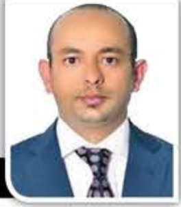
السفير محمد السادة

قد يكون من المتوقع تعثر الجهود الدبلوماسية للمبعوث الأمريكي إلى اليمن ليندر كينج في بداية مهمته، ولكن ما لم يكن متوقفاً هو السقوط المبكر للمبعوث في أول اختبار لجدية النوايا الأمريكية في إحلال السلام في اليمن؛ فمنذ إعلان الرئيس الأمريكي بايدين توجه إدارته نحو تفعيل جهودها لإنهاء الحرب على اليمن، تقود واشنطن بمعية وكلائها في المنطقة مناورة سياسية ودبلوماسية شاملة ضد صنعاء بأدوات إنسانية معلنة، وأهداف سياسية غير معلنة.