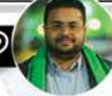
نصر الدين عامر

لو توجه سمو سيدك من قبل 6 أعوام للبناء والصناعة ووفر أمواله للشعب السعودي . ولم يدخل نفسه في عدوان على اليمن لمصلحة أمريكا ، لكان خيرا له ولكم . ولكنه باع نفسه للشيطان . كم خسر؟! وكم حطبه الأمريكي؟! وفي نهاية المطاف الخاسر الشعب السعودي . والمعاني الشعب السعودي .