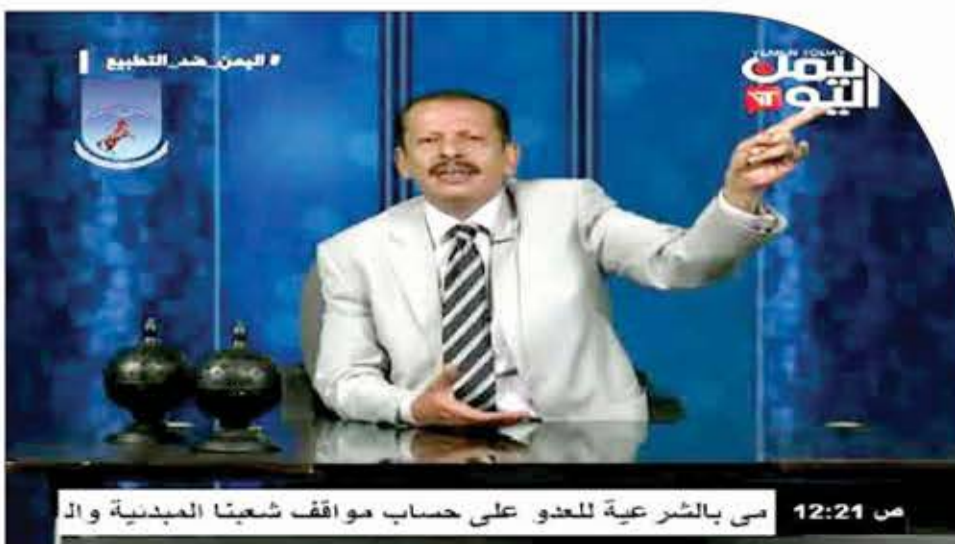
اليمن حرد التطبيع

ويضيف أن هناك تقصيراً كبيراً جداً في مواكبة الأحداث والبطولات، لكن لا يمكن أن يكون السبب قصوراً في التدريب والتأهيل، لأننا كنا نمضي إعلامياً بشكل جيد وحدث التقصير بشكل مفاجئ وبتنا نسمع مبررات سخيفة جداً على أنها السبب في منع نشر أخبار الجبهات، ومنها مثلاً أن النشر المواكب يضر بالمجاهدين باعتباره يحدد أماكنهم للعدو فيقتصمهم، وهذا مبرر سخيف للغاية لأن الغارات لا تعتمد على ما ينشر سواء بشكل رسمي أو عبر الإعلام الخاص ومواقع التواصل الاجتماعي، فغرفة عمليات العدوان تصلها الأخبار على مدار الساعة