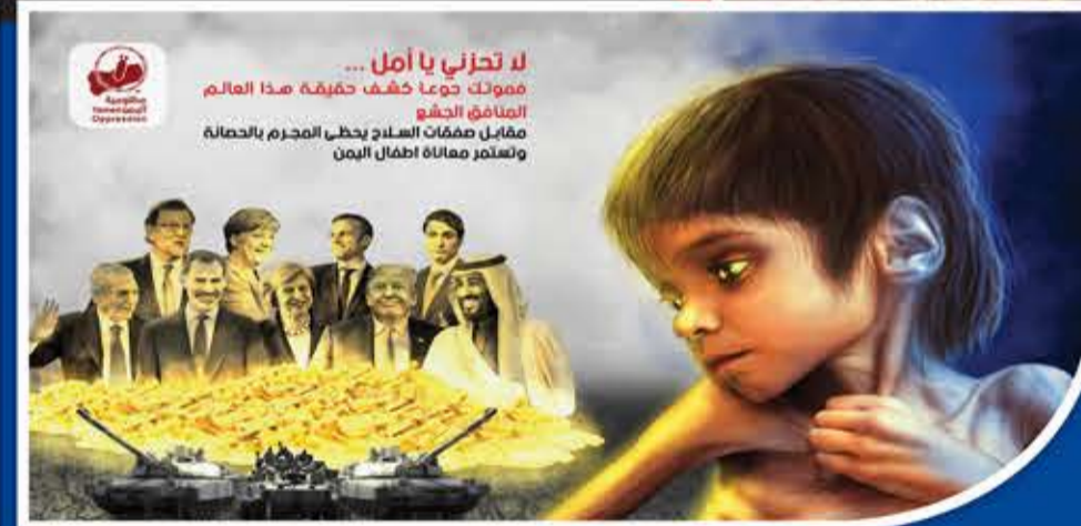
لا تحزني يا أمل... مموكت دوعا خشف حقيقته هذا العالم المنافق المشؤ مقابل صفات العنار يحظى المجرم بالحمالة ولتستمر معاناة أطفال اليمن