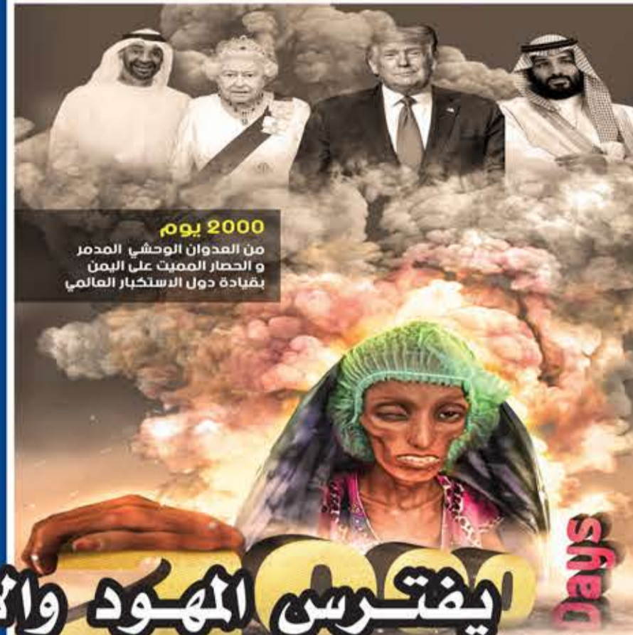
2000 يوم من العدوان الوحشي المدبر و الحصار المميت على اليمن بقيادة دول الاستكبار العالمي

الحوثي؛ الغرض من إقامة المعرض تقديم مظلومية اليمن بشكل إنساني وبطريقة تناسب مع جميع الفئات العمرية