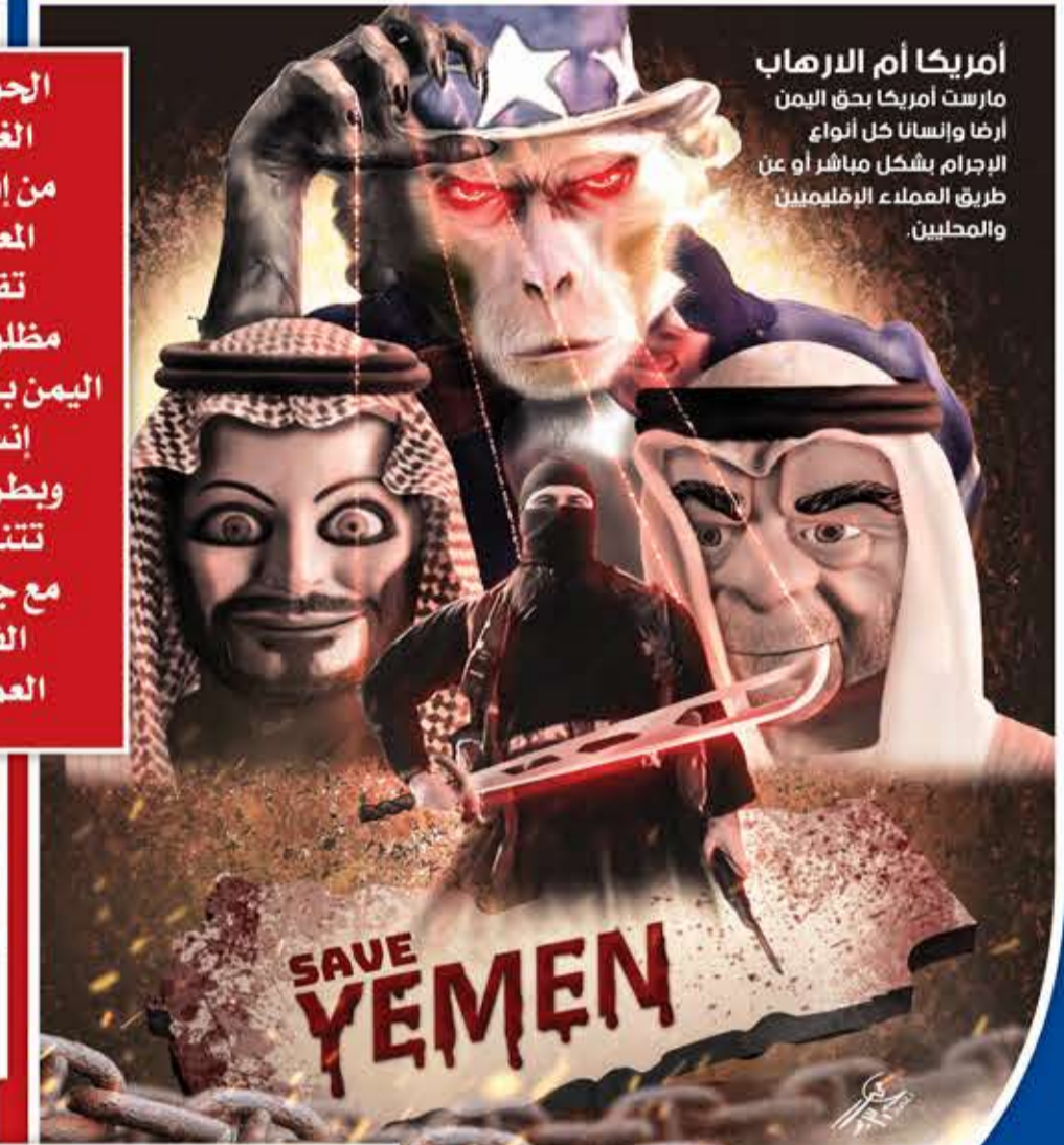
أمريكا أم الارهاب مارست أمريكا بحق اليمن ارضا والسائل كل أنواع الإجرام بشكل مباشر أو عن طريق العملاء الإقليميين والمحليين.

الحوثي؛ الغرض من إقامة المعرض تقديم مظلومية اليمن بشكل إنساني وبطريقة تناسب مع جميع الفئات العمرية