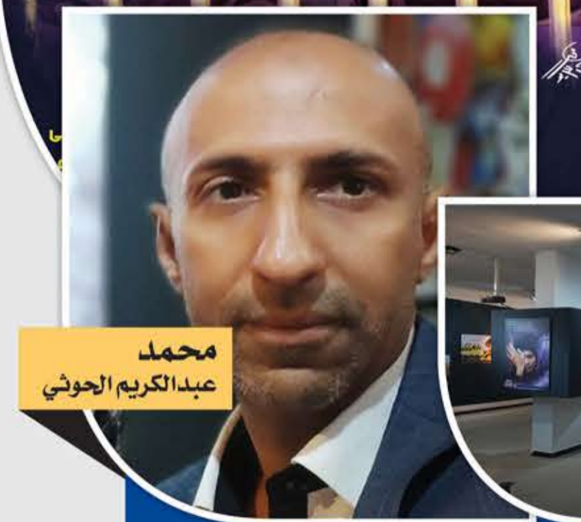
محمد عبد الكريم الحوثي