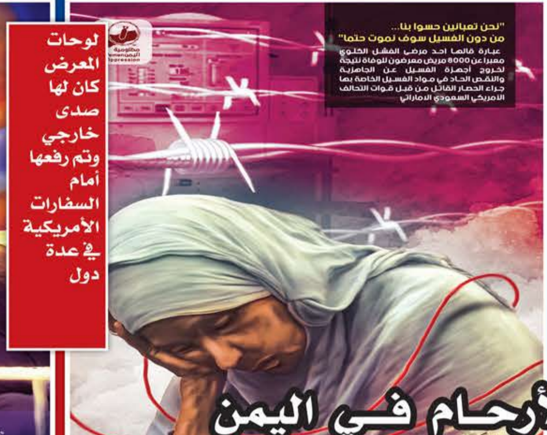
"نحن تيمانين حسوا بنا... من دون الفسيل سوف نموت جتما" عبارة قالها أحد مرضى الفسيل الحطوي معيًا من 8000 مريض ومريضون لوفاته نتيجة لخروج أجهزة الفسيل عن الحاضنة والنقص الحاد في مواد الفسيل الخاصة بها جراء الحصار القاتل من قبل قوات التحالف الأمريكي السعودي الإماراتي

لوحات المعرض كان لها صدى خارجي وتم رفعها أمام السفارات الأمريكية في عدة دول