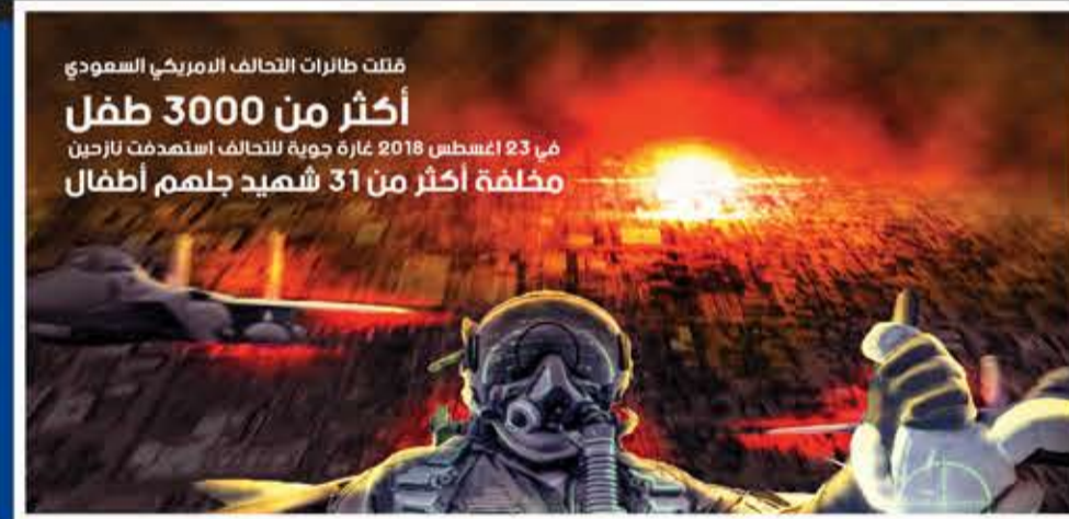
قتلت طائرات التحالف الأمريكي السعودي في 23 أغسطس 2018 غارة جوية للتحالف استهدفت لأربعين مخلفة أكثر من 31 شهيد جلم أطفال

تلق قاعة المعرض بخطى وثيقة. إحدى وأربعون لوحة رقمية معلقة على الحيطان، وهدوء يلف المكان. في حضرة ضحايا جرائم العدوان البربري الغاشم، يصبح الصمت هو اللغة التي تغني عن أي كلام.