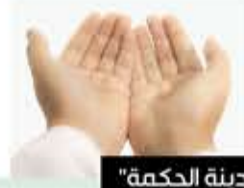
من كتاب "مدينة الحكمة"

"اللَّهُمَّ اجْعَلْ صِيَامِي فِيهِ صِيَامَ الصَّائِمِينَ، وَقِيَامِي فِيهِ قِيَامَ الْقَائِمِينَ، وَتَبَهَّئِي فِيهِ عَنِ نَوْمَةِ الْغَافِلِينَ، وَهَبْ لِي جَرْمِي فِيهِ يَا إِلَهَ الْعَالَمِينَ، وَأَعَفْ عَنِّي يَا عَافِيَا عَنِ الْمُجْرِمِينَ".