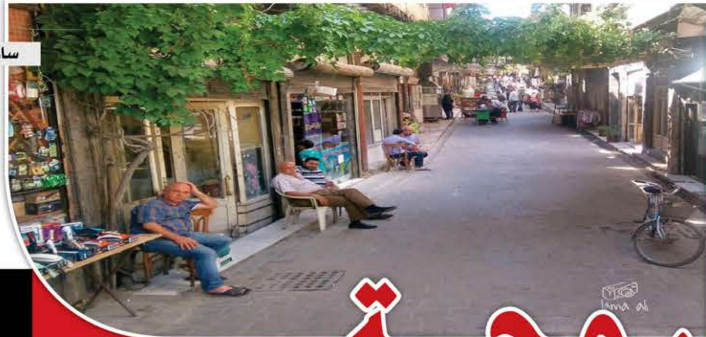
ساروجة - مشهد عام

يعتبر حي ساروجة من أهم ما تبقى من مدينة دمشق القديمة، وهو أول منطقة من دمشق بنيت خارج أسوار المدينة في القرن الثالث عشر الميلادي، وهو مواجه لقلعة دمشق. سُمي الحي بهذا الاسم نسبة إلى الأمير صارم الدين ساروجة المملوكي المتوفى عام 743هـ/1342، وفي رواية ثانية تقول إن التسمية أتت من الكلمة التركية «ساروجا» التي تعني اللون الأصفر.