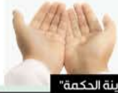
من كتاب "مدينة الحكمة"

"اللَّهُمَّ قَرِّبْنِي فِيهِ إِلَى مَرْضَاتِكَ، وَجَنِّبْنِي فِيهِ مِنْ سَخَطِكَ وَنَقَمَاتِكَ، وَوَفَّقْنِي فِيهِ لِقِرَاءَةِ آيَاتِكَ، بِرَحْمَتِكَ يَا أَرْحَمَ الرَّاحِمِينَ".