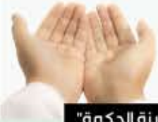
من كتاب "مدينة الحكمة"

"اللَّهُمَّ ارزُقْنِي فِيهِ رَحْمَةَ الْآيَاتِمِ وَأَطْعَامِ الطَّعَامِ وَأَفْشَاءَ وَضَحْبَةَ الْكِرَامِ، بِطَوْلِكَ يَا مَلْجَأَ الْأَمَلِينَ".