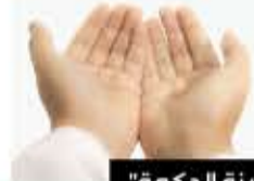
من كتاب "مدينة الحكمة"

"اللَّهُمَّ اجْعَلْ لِي فِيهِ نَصِيباً مِنْ رَحْمَتِكَ الْوَاسِعَةِ، وَاهْدِنِي فِيهِ لِبَرَاهِينِكَ السَّاطِعَةِ، وَخُذْ بِنَاصِيَتِي إِلَى مَرْضَاتِكَ الْجَامِعَةِ بِمَحَبَّتِكَ يَا أَمَلِ الْمُشْتَاقِينَ".