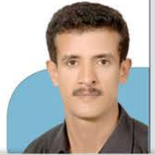
أكرم عبد الفتاح

من أهم أساليب التأثير النفسي والسلوكي التي تمارسها الرأسمالية على عقول وعواطف الشعوب صناعة النجوم وتلميعهم كنماذج جديدة بالإعجاب والافتداء، كي تستخدمهم في الترويج للسلع والأفكار والممارسات والتوجهات السياسية، بل وحتى لاستبدال المبادئ والقيم المجتمعية بقيم استهلاكية أو بقناعات ومعايير تطغى على قيم المجتمع