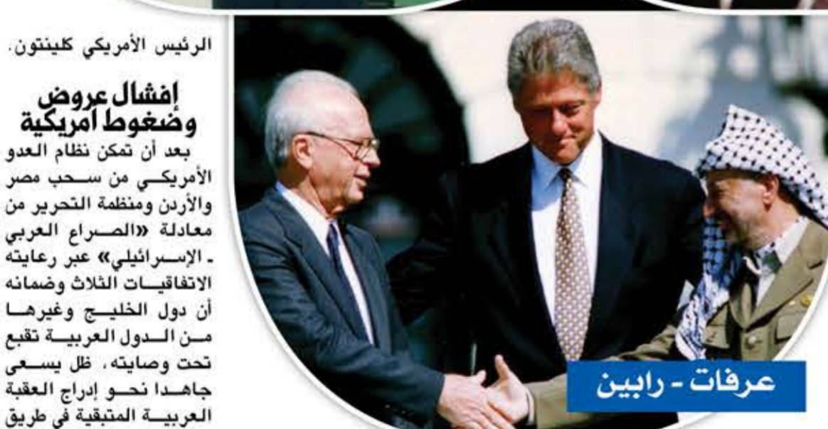
عرفات - رابين

21 الروسية ذات التقنية العالية، كما نجحت مراكز الأبحاث العسكرية السورية في تطوير منظومة صواريخ «إس 200» وشكل قرار روسيا تسليم سورية منظومة صواريخ «إس 300» للدفاع الجوي إلى جانب منظومة التحكم الإلكترونية والتقنية، شكل تطورا نوعيا في موازين القوى العسكرية للمرة الأولى في تاريخ الصراع العربي الصهيوني، عززت قدرات سورية الردعية في مواجهة الطيران الصهيوني.