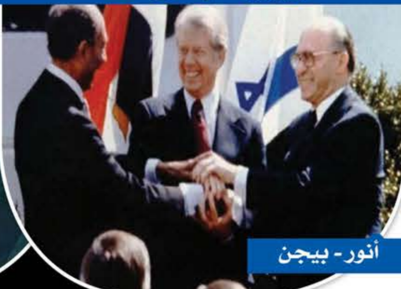
أنور - بيغن