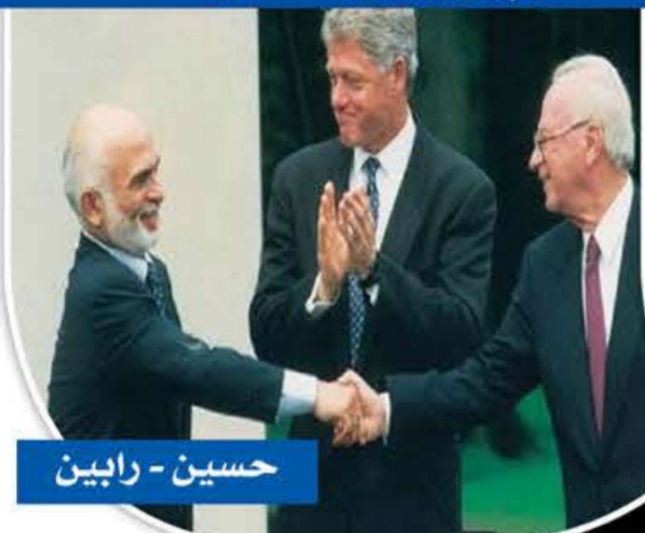
حسين - رابين

تغادره إلى أرضية «التطبيع» كما فعلت الكثير من البلدان لاسيما التي كانت على علاقة مباشرة مع القضية الفلسطينية وترتبط معها بحدود جغرافية أولها مصر التي وقع رئيسها أنور السادات اتفاقية سلام مع رئيس وزراء كيان العدو مناحيم بيغن في 1979 سميت «اتفاقية كامب ديفيد» رعايته من رئيس نظام العدو الأمريكي وقتها جيمي كارتر، ثم تبعها منظمة التحرير الفلسطينية التي كان يرأسها ياسر عرفات عبر توقيعها ما سميت «اتفاقية أوسلو» مع كيان العدو الذي كان يرأسه حينها إسحق رابين في 13 سبتمبر 1993، برعاية الرئيس الأمريكي بيل كلينتون، ثم تلاها الأردن أثناء فترة حكم الحسين بن طلال في 26 أكتوبر 1994 عبر توقيعها ما سميت «اتفاقية وادي عربة» التي وقعها مع رئيس وزراء كيان العدو إسحق رابين برعاية