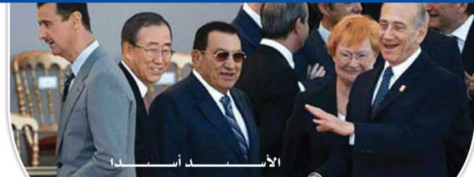
الأنور - بيغن