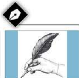
كارلوس شهاب *

تمثل الخطر بفكرة المقاومة ذاتها وما يمكن أن تغيره بمحيطها، وإليك حديث تشارلز غوردون القديس العسكري البريطاني الذي أوكلت إليه مهمة تصفية هذه الظاهرة قبل أن يرسله سيف أحد الدراويش إلى مستقره الأخير "ليس الخطر هو أن يسير المهدي شمالاً مخترقاً وادي حلفا، بالعكس، فمن غير المحتمل له أن يتقدم شمالاً. إن طبيعة الخطر مختلفة تماماً. يتمثل الخطر في الأثر الذي سيجده مشهد قوة محمديّة غازية، قائمة بالقرب من حدودنا على السكان الذين نحكمهم. سيسهر المصريون في جميع المدن أن بإمكانهم فعل ما فعله المهدي، وبما أنه نجح في طرد الدخلاء والكفار، يصبح باستطاعتهم فعل ما فعله".