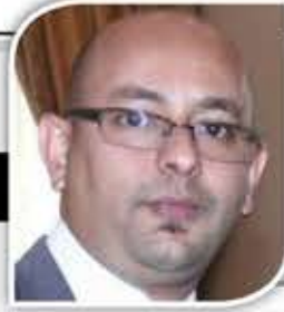
السفير/ محمد محمد السادة