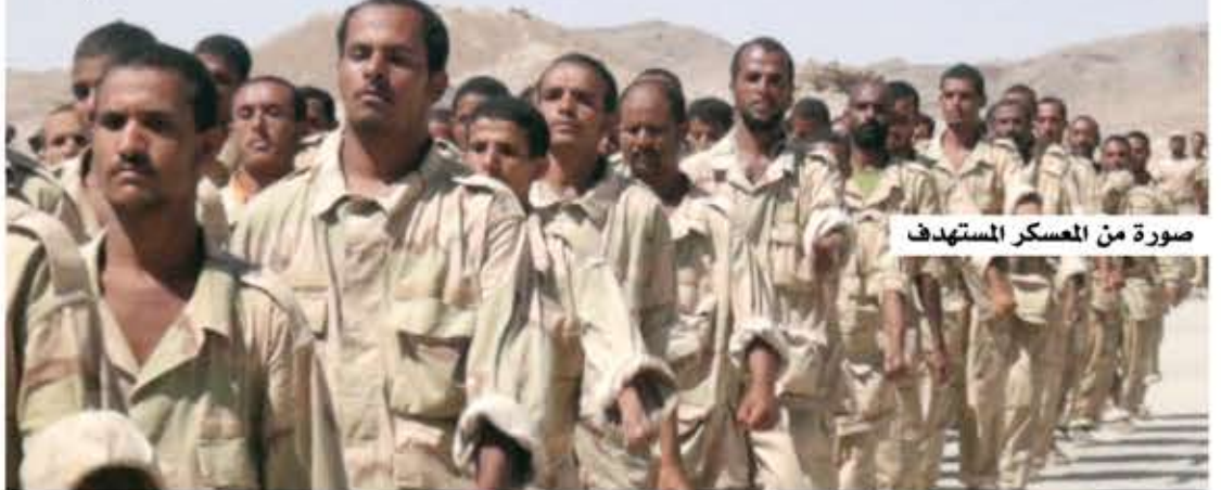
صورة من المعسكر المستهدف

سقط العشرات قتلى وجرحى، أمس، بانفجارات عنيفة داخل معسكر تابع لقوات الاحتلال في منطقة الوديعة بمحافظة حضرموت المحتلة. وقالت مصادر محلية إن عشرات القتلى والجرحى سقطوا بانفجارات عنيفة