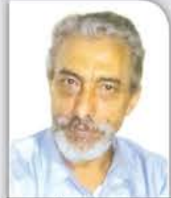
علي نعمان المقطري

أما القسم الساحلي لتعز، فقد قسم على الإمارات والسلفيين الجنوبيين وطارق عفاش وبقي تحت إشراف الإمارات نيابة عن السعودي الأمريكي، وأخيراً أعلنت الإمارات بعد نكسة الساحل والحديدة خروجها من الحرب في اليمن وسلمت المنطقة العسكرية الساحلية لطارق عفاش باعتباره يمثل النضوذ الإماراتي "الإسرائيلي" المشترك الذي أنيط به حماية ممر باب المندب والجزر وساحل تعز الغربي والمخا وذو باب التي هي مركز وقاعدة التمركز الإماراتي العدوانية في المنطقة، وفيها خزنت الإمارات الكثير من المعدات والأسلحة بعد أن سحبت أغلب ألوية العمالة إلى المناطق الجنوبية الغربية، ووضعت بدلا عنهم ألوية المرتزق طارق عفاش ليحافظ لها على ما تم السيطرة عليه طوال الأعوام الأولى من العدوان من ساحل تعز الغربي.