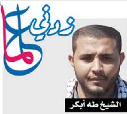
الشيخ طه أكبر

وتكمن قوة "لا إله إلا الله" في أنها تقضي في نفوس العالمين بها على كل معنى من معاني الفساد، لأن كل فساد ظهر ويظهر لا يكون إلا من اتخاذ آلهة مع الله سبحانه وتعالى من الأرض أو الهوى الذي يكون من النفس. ولهذا فقد قال اللطيف الخبير