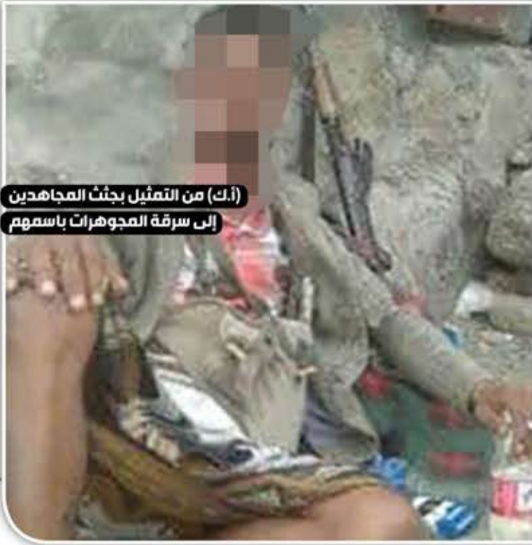
(أ.ك) من التمثيل بجثث المجاهدين إلى سرقة المجوهرات باسمهم