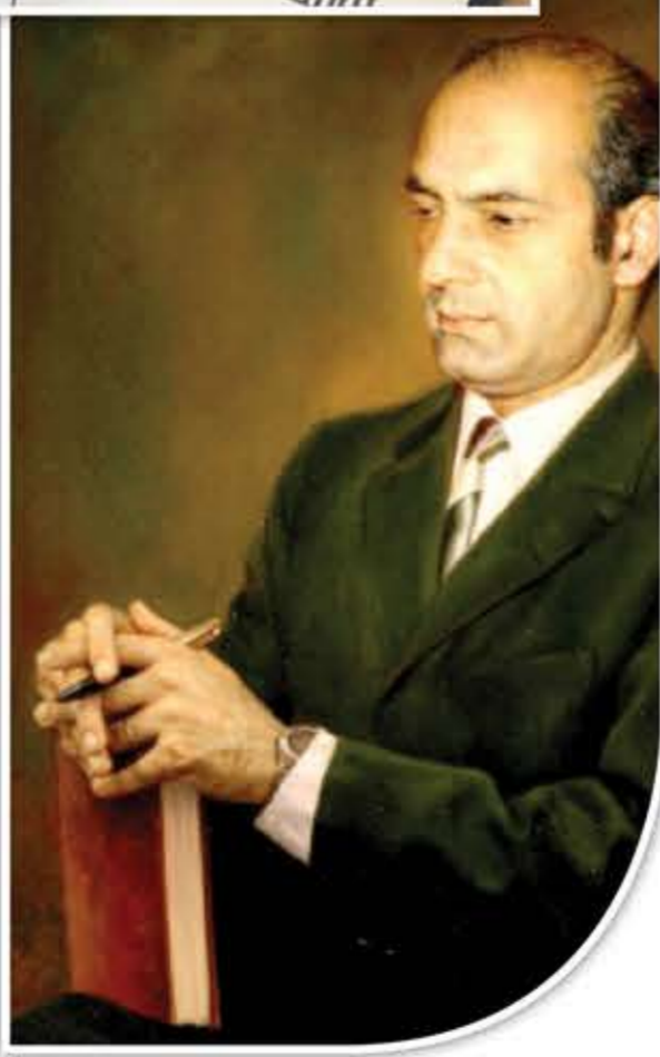
بأفكاره وأطروحاته وتفاعله مع مشاكلها. أما المثقف المقلد فهو الذي تمّ استنساخه على نموذج المثقف الأوروبي في حضارات وسياقات مختلفة في الشرق والغرب، ويبقى هذا المثقف المقلد شاذاً في موضعه من المجتمع الذي لم ينتجه ويبقى غير قادر على التفاعل مع قضاياها، ما لم ينتج أدواته الخاصة ويتحرر من أصل التبعية الثقافية الأوروبية، التي عانت في بداياتها من استبداد الدين والسلطة، فخدمها هذا المثقف التي اصطنعتها.

ورغم مرور 44 عاماً على رحيله، و88 عاماً على ولادته، فإن أفكاره عن المثقف