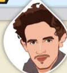
أبو حسين الرازي

إن الصراع في سبيل الحق هو انتصار في كلتا الحالتين، أكانت نتيجته الاستشهاد المضيء، أو النصر الساحق.