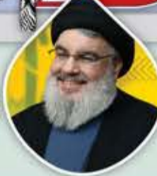
سماحة السيد حسن نصر الله

لا يمكن تحرير فلسطين بمعزل عن مواجهة الهيمنة الأمريكية في المنطقة، لأن هذه الهيمنة حولت جيوش المنطقة إلى هياكل فارغة.