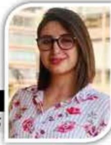
ندين عباس كاتبة وصحفية لبنانية