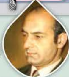
د. علي شريعتي

الخيانة الاقتصادية في الأموال العامة حكمها القتل عند علي، لأنها مسألة فقهية، اقتصادية، حقوقية واجتماعية.