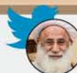
آيه الله الشيخ حسين الرازي

الشهيد أحمد بن سعيد بن علي الجنبي من القطيف. لم يعلم أحد أنه كان معتقلاً! لم يعلم أحد أنه يحاكم! لم يعلم أحد بأنه صدر ضده حكماً بالإعدام! صباح اليوم (أمس) تم إعدامه بتهمة الخروج على ولي الأمر الإرهابي سلمان بن عبدالعزيز. #السعودية #القطيف #الإحصاء