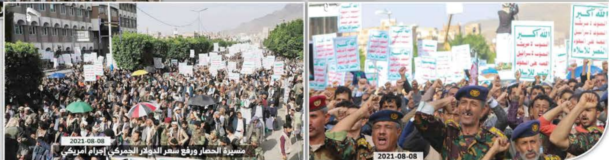
مسيرة الحصار ورفع سعر الدولار الجمركي إجرام أمريكي