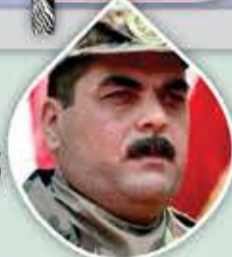
الشهيد سمير القنطار عميد الأسرى اللبنانيين