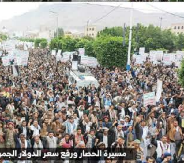
مسيرة الحصار ورفع سعر الدولار الجمركي إجرام أمريكي