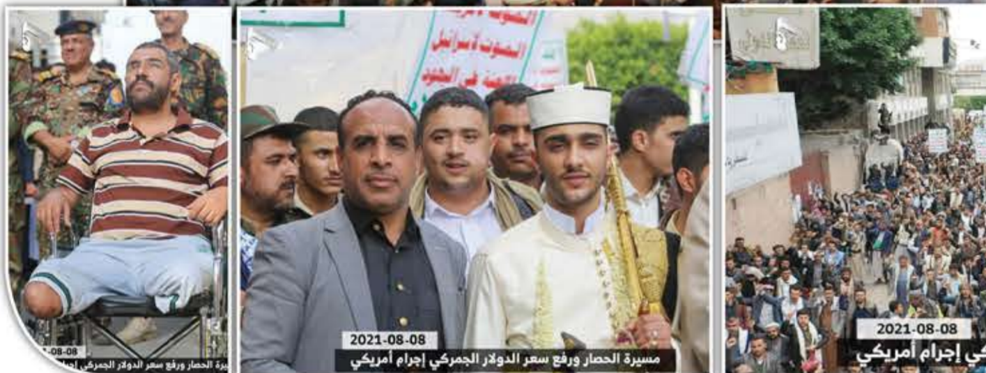
مسيرة الحصار ورفع سعر الدولار الجمركي إجرام أمريكي