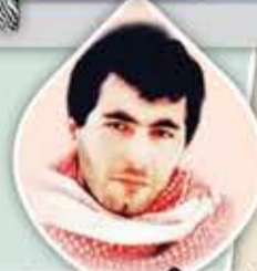
الشهيد المهندس يحيى عياش

بإمكان اليهود اقتلاع جسدي من فلسطين، غير أنشي أريد أن أزرع في الشعب شيئاً لا يستطيعون اقتلاعه.